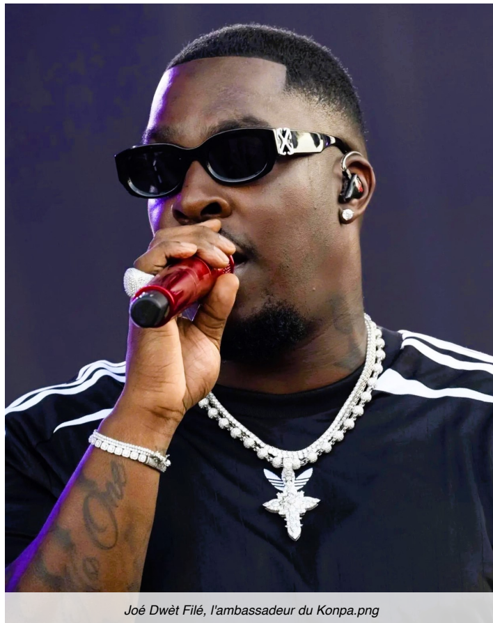
Joé Dwèt Filé, l'ambassadeur du Konpa.png

Dans une époque où l'image du pays est souvent dominée par les mauvaises nouvelles, cette réalité mérite d'être soulignée. Car la culture possède une force que les crises ne peuvent facilement détruire: Elle voyage. Elle s'adapte. Elle survit. Et, parfois, elle triomphe.